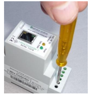
Abbildung 1-Wire Controller 1

Sollte das Update fehlerhaft sein, z. B. durch einen Stromausfall während des Updates, können Sie die Wiederherstellungsfunktion nutzen. Hierzu halten Sie den Reset Button gedrückt (dieser befindet sich unter dem Loch 30 auf der Moduloberseite), starten das Update im Config-Tool 3 und lassen den Reset Knopf nach ca. 1 Sekunde nach Start im Config-Tool 3 los. Nun sollte das Update starten. Nach Durchführen eines Updates empfehlen wir Ihnen den 1-Wire Controller / 1-Wire Gateway für ca. 30 Sekunden vom Strom zu trennen und neu zu starten. Sollten Sie Probleme bei der Installation haben, helfen wir Ihnen gerne weiter. Wenden Sie sich einfach per E-Mail an unseren Support (support@esera.de).