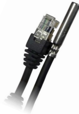
Sensoren mit RJ11/12 bzw. RJ45 Stecker