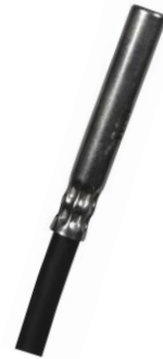
Sensoren OK bzw. OKS